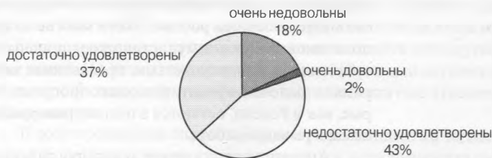
Рисунок 1 Степень удовлетворенности демократией в собственной стране (в среднем по 10 странам Восточной и Центральной Европы)