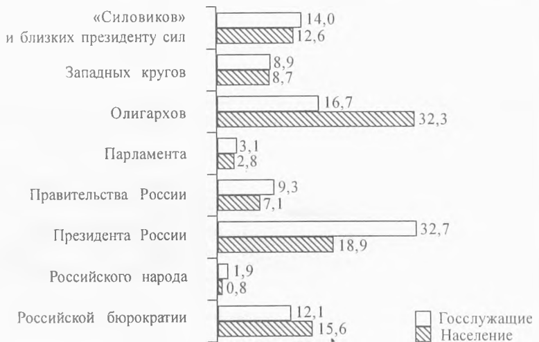
Рисунок 3 Как Вы считаете, в чьих руках сегодня находится реальная власть в стране? (в %)

С позицией респондентов-госслужащих солидаризируются сторонники «Единой России», среди которых также больше тех (43,7%), кто считает, что власть в стране прочно удерживают федеральные органы власти. Иной точки зрения придерживаются сторонники оппозиционных партий: «левые» (КПРФ, «Родина»), а также сторонники ЛДПР отдают в данном вопросе пальму первенства «олигархам», а «правые» (СПС и особенно «Яблоко») – бюрократии. Причем, «Яблоко» – бюрократии «гражданской», а СПС – «силовой» (см. табл. 3).