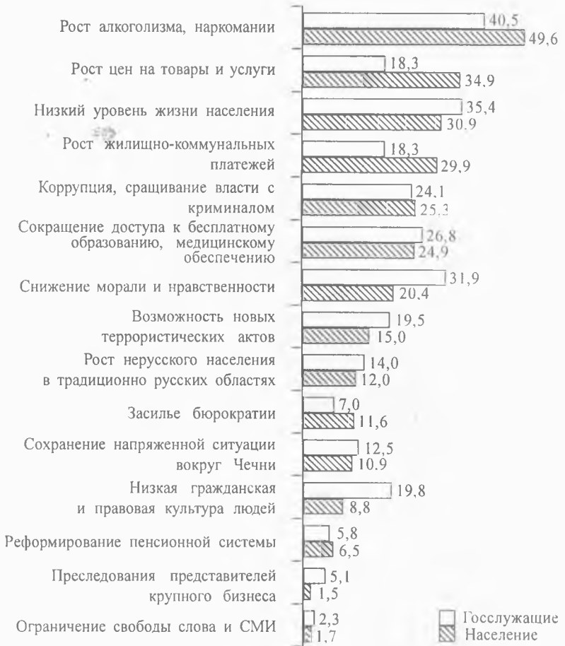
Рисунок 4 Какие события и процессы, происходящие в последнее время в жизни страны, вызывают у Вас наибольшую тревогу? (в %)

чили должного развития в России. Это прежде всего относится к законодательным органам власти, судебной системе, средствам массовой информации, политическим партиям и профсоюзам.