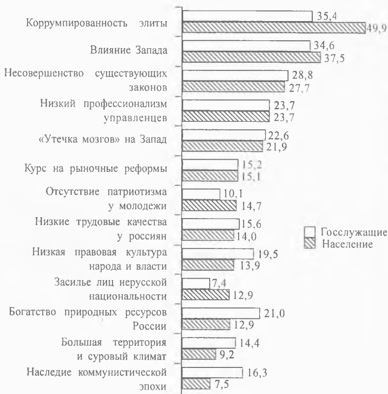
Рисунок 2 Что, на Ваш взгляд, прежде всего, препятствует быстрому экономическому росту России? (в %)

Характерно, что даже на ассоциативном уровне россияне достаточно определенно «разводят» массовый слой госслужащих и бюрократию. Так же, как они дифференцируют государство и власть. Как видно из данных, приведенных в таблице 1, понятия «государство» и «государственные служащие» вызывают у наших сограждан скорее позитивное чувство, тогда как понятия «власть» и «чиновничество» – негативное. Любопытно, что у самой бюрократии термин «чиновники» вызывает негативные ассоциации. Ей больше по душе, когда ее представителей называют государственными служащими.