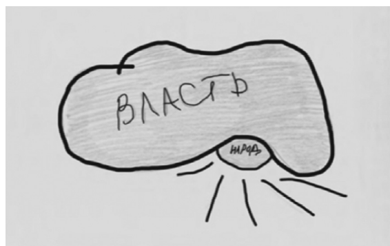
Рисунок 2 Образ российской власти (мужчина, 28 лет, среднее образование, Тыва)

Образ лидера и его место в образе страны. Российская культура традиционно персонифицирована. Это побудило нас посмотреть, кто из современников символизирует для респондентов нашу страну. Результаты (см. табл. 2) свидетельствуют о значительном влиянии СМИ на представления граждан. Наиболее упоминаемыми фигурами оказались политические деятели и звезды шоу-бизнеса, спортсмены, представители публичных профессий (ученые, священнослужители, телеведущие, журналисты). Однако известность не делает автоматически этих людей героями в глазах общества.