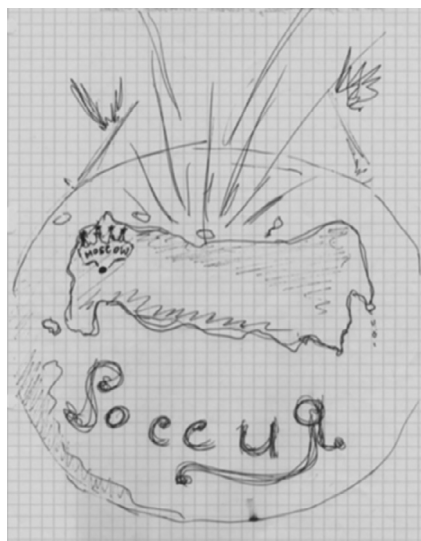
Рисунок 3 Внешнеполитический образ России (мужчина, 19 лет, среднее образование, Москва)

Второй, «уклонистский», подход связан с призывом «оставить Россию в покое» (3%). При этом не вполне ясно, кому адресован этот призыв — своей власти или внешнему миру. Впрочем, и в том, и в другом случае такую позицию трудно назвать реалистической.