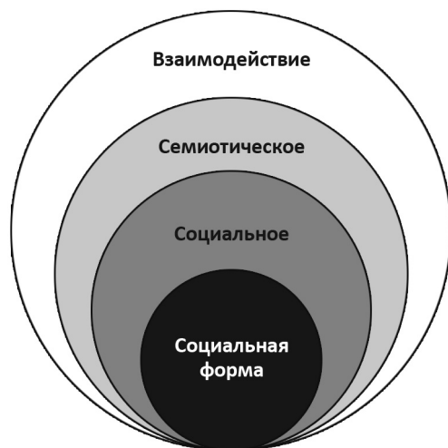
Рисунок 1 Соотношение объема понятий «социальная форма», «социальное», «семиотическое», «взаимодействие»

Социальная форма — это прежде всего знаковый комплекс, посредством которого реализуется тот или иной тип взаимодействия, будь то интимный союз или институт правосудия. Раскрыть этот знаковый комплекс в его качественной определенности, целостности, взаимно-логическом соответствии частей — задача формально-социологического анализа.