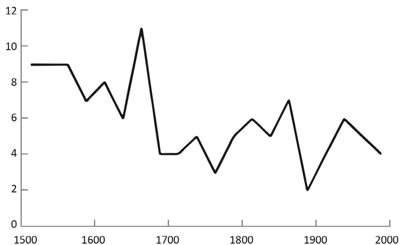
Рисунок 2 Продолжительность войн между великими державами 55