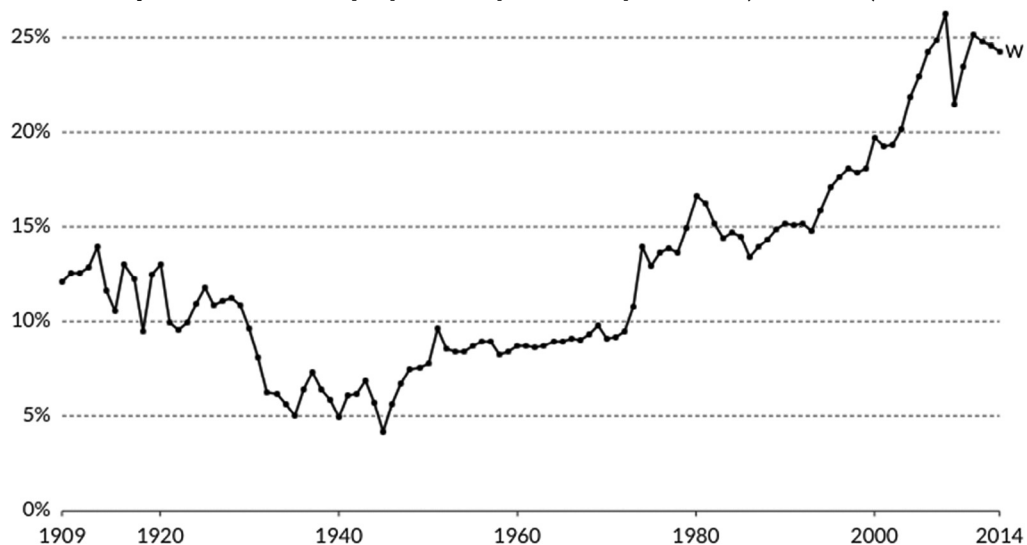
Рисунок 2 Доля международной торговли в мировом ВВП (1909–2014)

Источник: Ortiz-Ospina E. and D. Beltekian. (2018) «Trade and Globalization» // Our World in Data . URL: https://ourworldindata.org/trade-and-globalization (accessed on 30.04.2021).