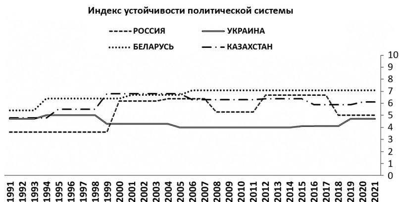
Рисунок 2 Устойчивость политических систем России, Беларуси, Украины и Казахстана в постсоветский период