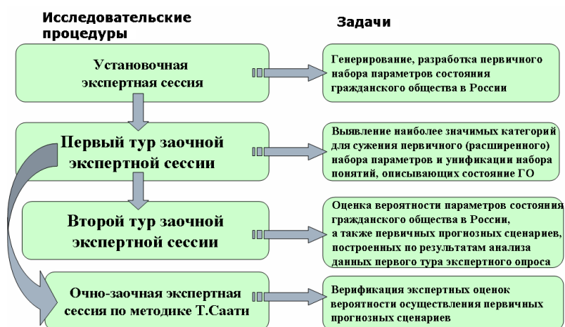
Рисунок 1 Схема реализации исследования

Для того чтобы быть максимально корректными в методологическом отношении, мы реализовали довольно сложную схему исследования, включавшую в себя в общей сложности четыре исследовательские процедуры (см. рис. 1).