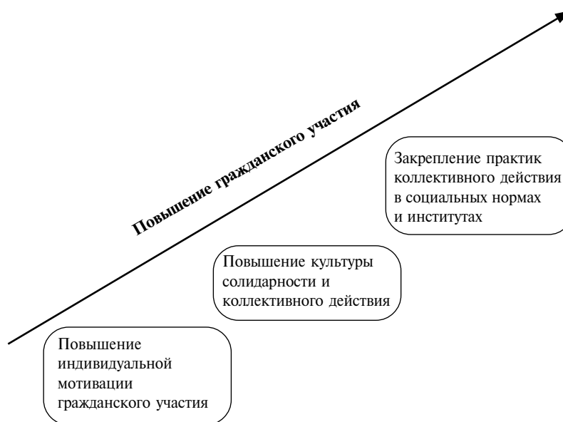
Рисунок 2 Лестница повышения гражданского участия

Исходя из предложенной схемы, можно сформулировать три класса задач, от решения которых зависит успех развития гражданского общества в России.